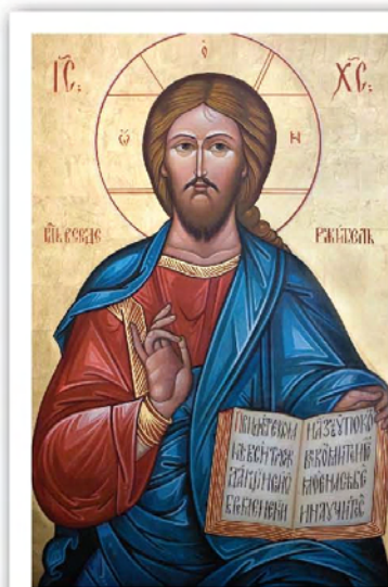
Icon, Sheptytsky Institute Chapel

Metropolitan Andrey Sheptytsky Institute of Eastern Christian Studies Saint Paul University