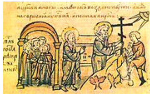
St Andrew's prophecy of Kiev depicted in Radzivil Chronicle.

Andrew is said to have been martyred by crucifixion at Parts (Patrae) in Achaea. Andrew had been crucified on a cross of the form called Crux decussata (X-shaped cross) and commonly known as "Saint Andrew's Cross"; this was performed at his own request, as he deemed himself unworthy to be crucified on the same type of cross on which Christ was crucified. "